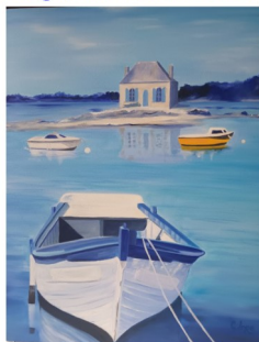
Salle de la Mairie LOGONNA - DAOULAS